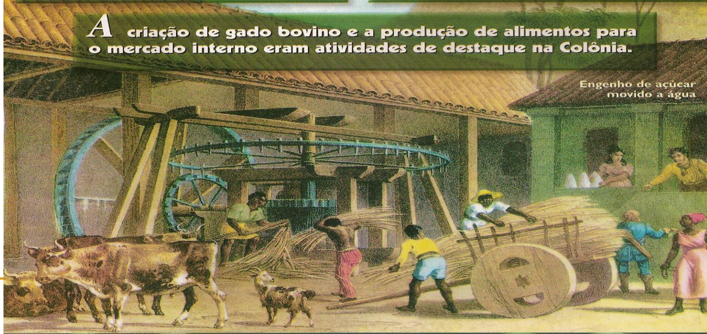
Engenho de açúcar movido a água

A criação de gado bovino e a produção de alimentos para o mercado interno eram atividades de destaque na Colônia.